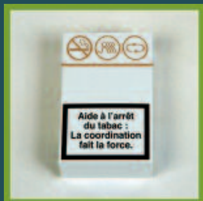
Creation LD Communication

Si vous souhaitez utiliser ce dispositif, vous pouvez contacter Matthieu Birebent, chef de projet ADDICA (06 73 46 32 99), il vous guidera pour vos premiers pas.