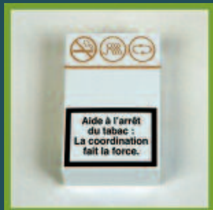
Creation LD Communication

Si vous souhaitez utiliser ce dispositif, vous pouvez contacter Matthieu Birebent, chef de projet ADDICA (06 73 46 32 99), il vous guidera pour vos premiers pas.