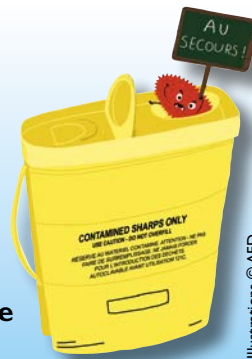
Illustrations © AFD

2 sites de récupération sont à votre disposition : l'un sur le site SITA DECTRA à La Chapelle Saint Luc, l'autre à l'hôpital de Troyes.